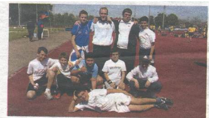
La Polisportiva Rivarolese, 14° su 32 società partecipanti