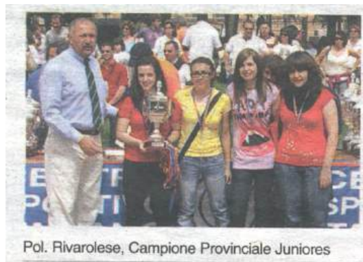
Pol. Rivarolese, Campione Provinciale Juniores